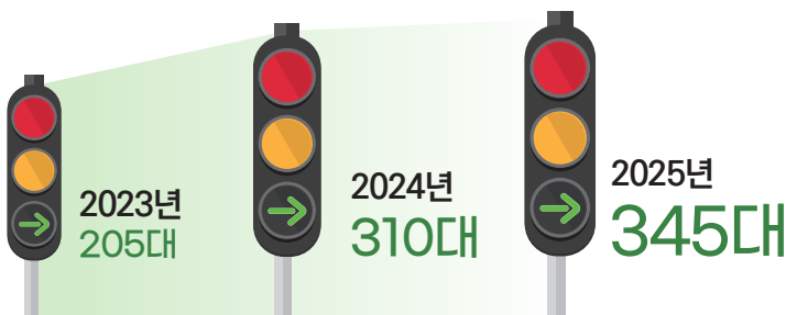
| 전국 우회전 신호등 설치 현황 |